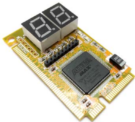
Общий вид устройства. Рис.1

Описание широко распространенных POST кодов можно найти на странице устройства сайта http://www.masterkit.ru