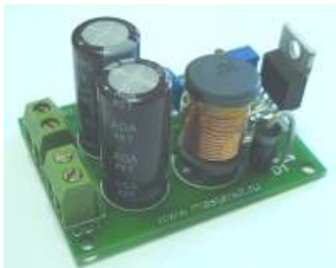
Рис.1 Общий вид устройства

Данный импульсный стабилизатор с регулируемым выходным напряжением предназначен для установки в радиолюбительские устройства. Стабилизатор работает в импульсном режиме на частоте около 150 кГц, имеет высокий КПД и (в отличие от линейных стабилизаторов) не нуждается в большом теплоотводе. Устройство имеет тепловую защиту и защиту по выходному току 3А.