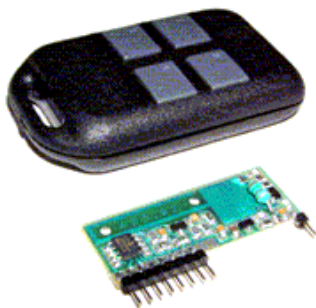
Рис.1 Общий вид приемника и передатчика

Устройство дистанционного управления представляет собой комплект из четырехкнопочного передатчика, сделанного в виде брелока, и приемника, в виде платы размером 40x15 мм, имеющего логические выходы. Каждый выход приемника управляется соответствующей кнопкой на пульте передатчика, при этом на выходах приемника формируются уровни логической единицы. Передача команд осуществляется по радиоканалу на частоте 433 МГц широтно-импульсной модуляции. Каждый пульт и приемник имеет свой персональный (прошитый) код, поэтому какие-либо совпадения между комплектами исключены.