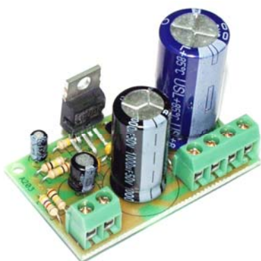
Рис.1 Общий вид устройства

Предлагаемый набор позволит радиолюбителю собрать простой и надежный усилитель НЧ класса Hi-Fi, обладающий минимальным коэффициентом нелинейных искажений и уровнем собственных шумов. Устройство обладает малыми габаритами, широким диапазоном питающих напряжений и сопротивлений нагрузки. Области применения данного УНЧ крайне разнообразны.