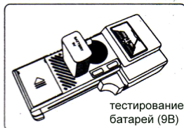
тестирование батареи (9В)