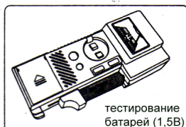
тестирование батареи (1,5В)