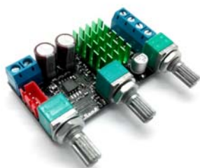
Общий вид устройства. Рис.1

Общий вид устройства представлен на рис.1